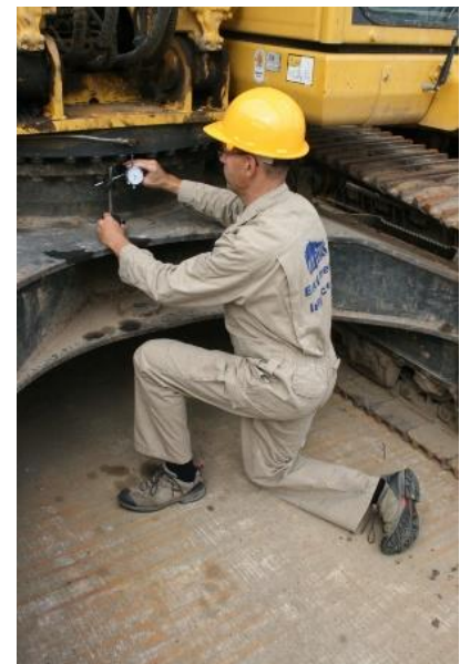
Medición del juego de la corona

Posibles problemas con los cojinetes oscilantes: Con el tiempo, es inevitable que se produzca cierto juego en los cojinetes. Sin embargo, este juego puede producirse más rápidamente si se descuida el mantenimiento o se dañan las juntas. Cada cojinete de giro tiene un nivel de tolerancia, y los valores aceptables son conocidos por el fabricante del equipo o su personal de servicio. Se sabe que algunas marcas de excavadoras, como Komatsu e Hitachi, tienen holguras significativas, incluso en rodamientos nuevos. Sin embargo, esta holgura se produce más a menudo