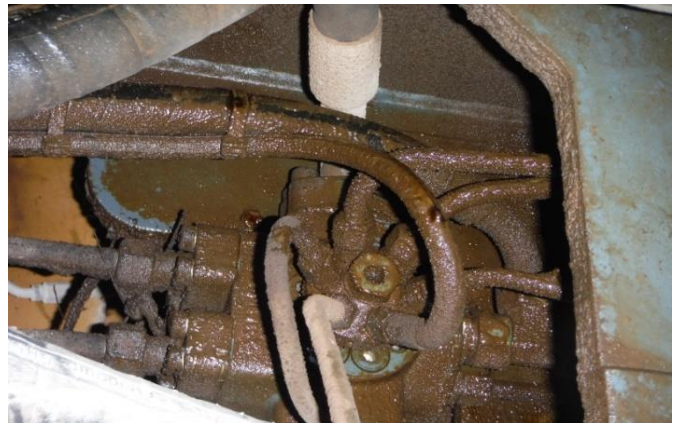
Junta Giratoria de Excavadora con fugas del aceite

Una excavadora tiene el motor y la bomba hidráulica dentro de la superestructura. Pero los motores de tracción de las excavadoras sobre orugas están montados en el chasis. La superestructura gira sin fin y, de alguna manera, el aceite a presión tiene que bajar hasta estos motores sin perforar las mangueras hidráulicas. En algunas excavadoras existe incluso una hoja dózer. También esta hoja se mueve mediante cilindros hidráulicos. Esto significa que se necesita una pieza específica para conducir el aceite hasta el sistema hidráulico en el portador.